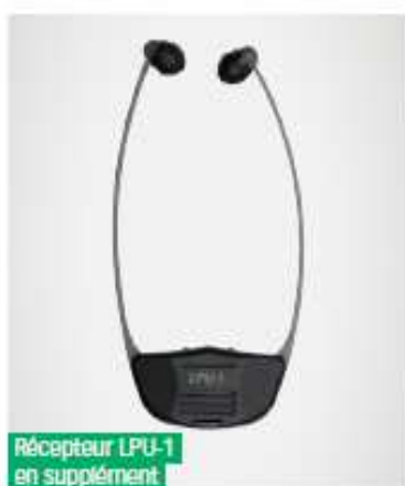
Récepteur LPU-1 en supplément