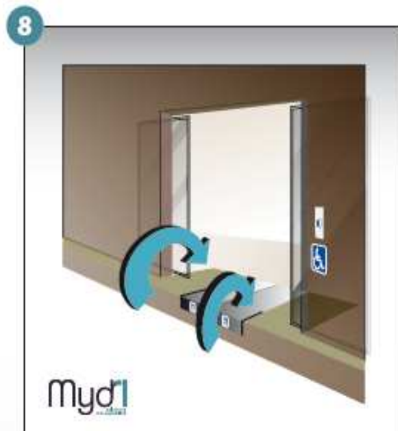
8 - Répéter les manoeuvres précédentes en sens inverse pour fermer la rampe.