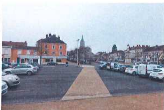
Photographie des extérieurs – Parking existant à proximité de l'agence. La nouvelle agence se situe au fond de la photo, à l'angle du bâtiment couleur « saumon ».

Le projet se situe dans un contexte de centre-ville et n'a pas de place de stationnement attribué.