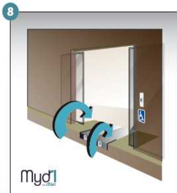
8 - Répéter les manoeuvres précédentes en sens inverse pour fermer la rampe.