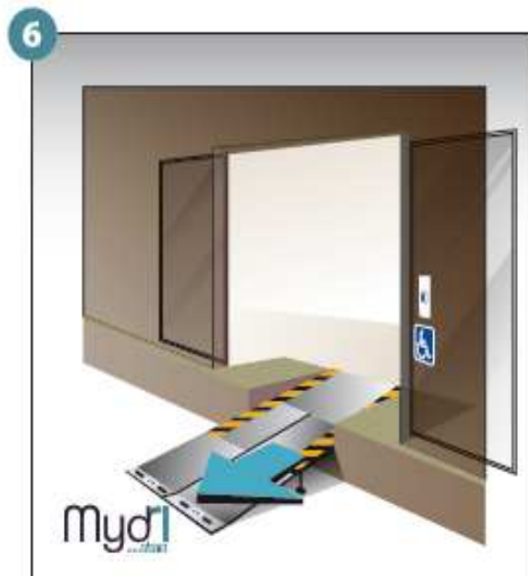
6 - Répéter les opérations pour le deuxième volet