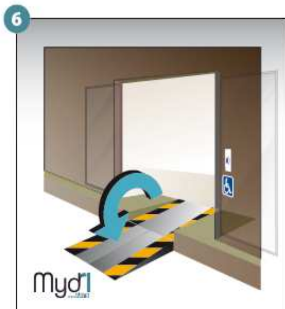
6 - Répéter les opérations pour la deuxième rampe.