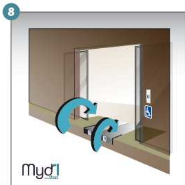
8 - Répéter les manoeuvres précédentes en sens inverse pour fermer la rampe.