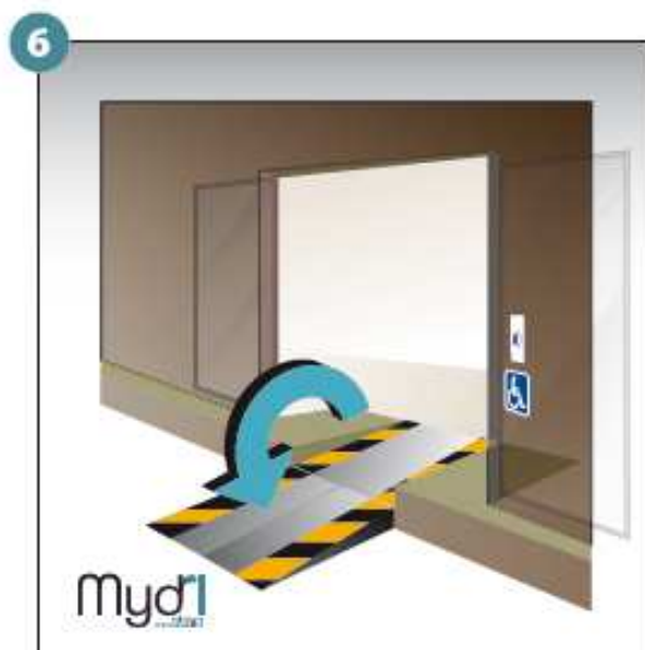
6 - Répéter les opérations pour la deuxième rampe.