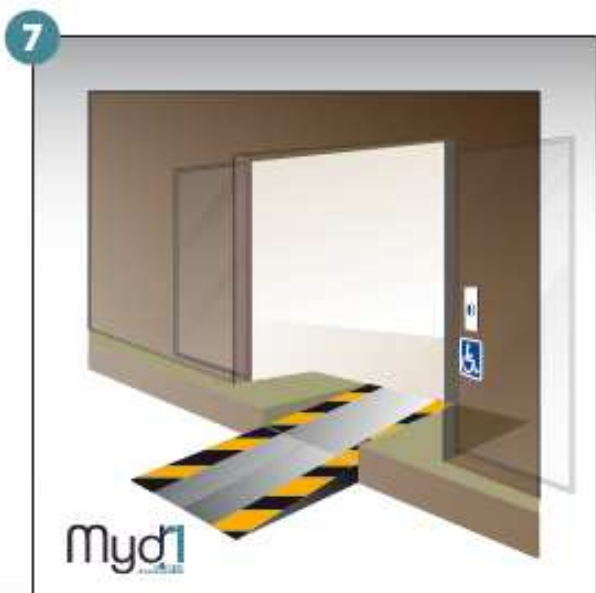
7- Rampe en service.