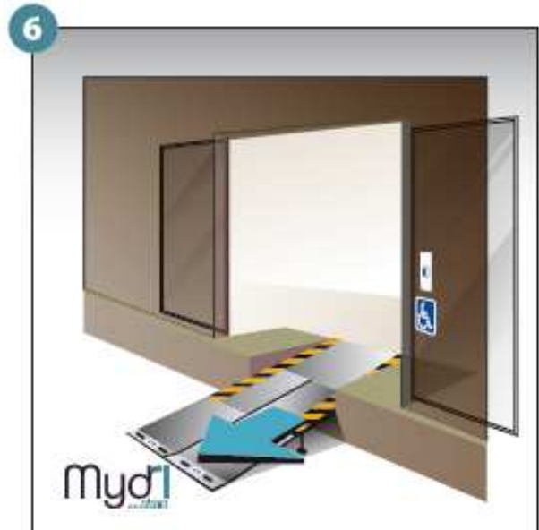
6 - Répéter les opérations pour le deuxième volet