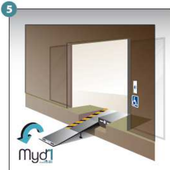
5 - Basculer la poignée qui prolongera la rampe