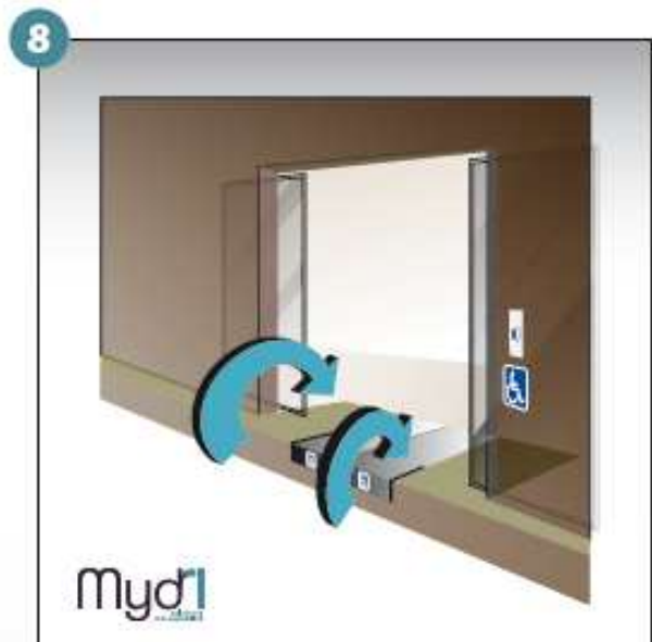
8 - Répéter les manoeuvres précédentes en sens inverse pour fermer la rampe.