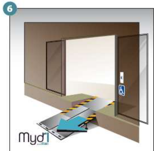
6 - Répéter les opérations pour le deuxième volet