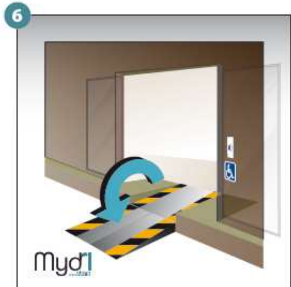
6 - Répéter les opérations pour la deuxième rampe.